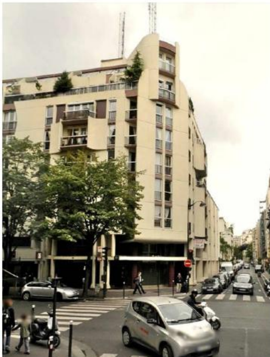
Etat de l'existant :