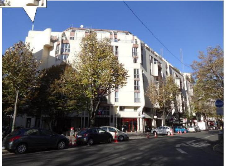
Etat projeté :