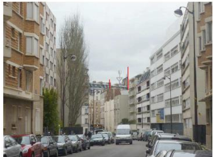
DP 8 - Photo du projet, vue lointaine