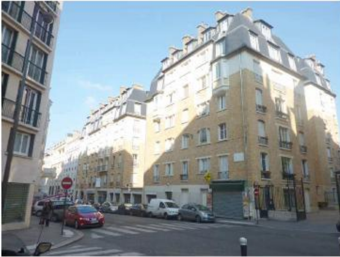
DP 7.1 - Photo de l'existant