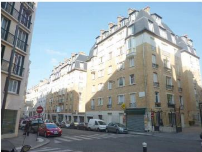
DP 6.1 - Photo du projet (les antennes sont invisibles depuis ce point de vue)