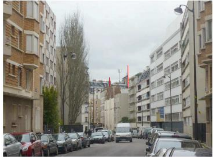
DP 8 - Photo de l'existant, vue lointaine