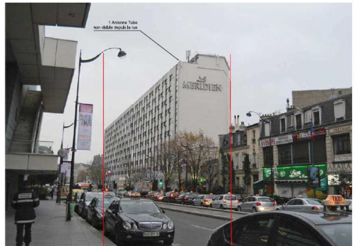
DP 6.1 - Photo du projet, vue de la rue (non visible)