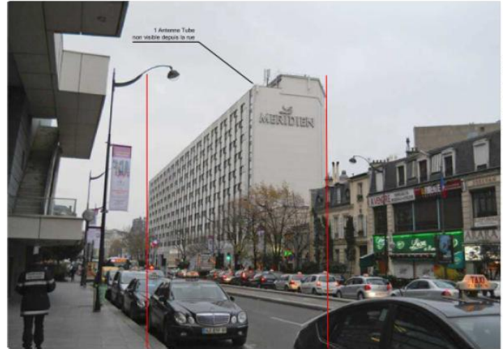
DP 8.2 - Photo de l'existant, vue lointaine