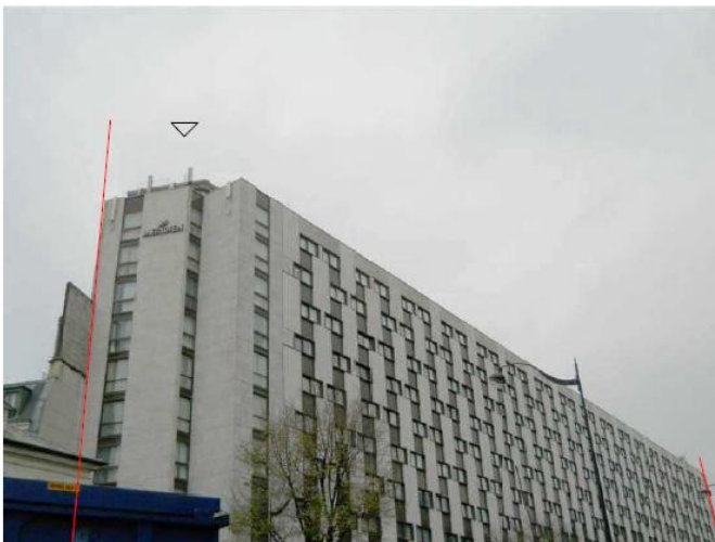
DP 6.1 - Photo du projet