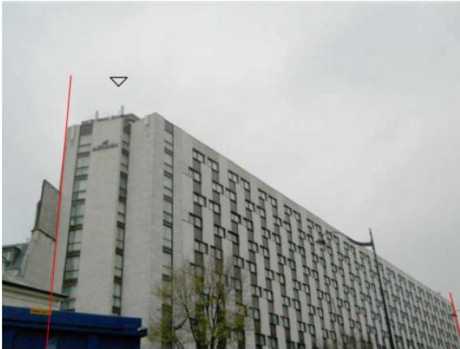
DP 7.1 - Photo de l'existant

REPLACEMENT À L'IDENTIQUE SANS IMPACT VISUEL