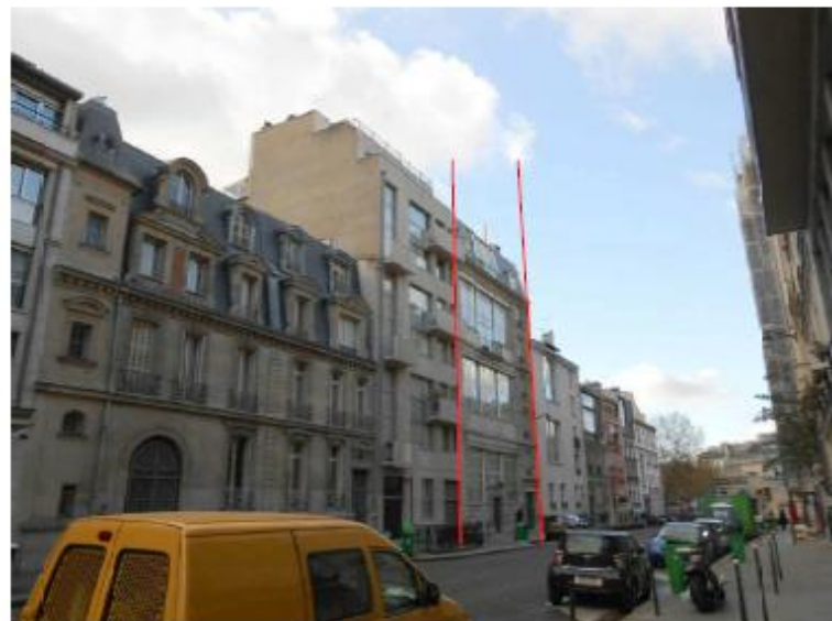
DP 8 - Photo du projet, vue lointaine