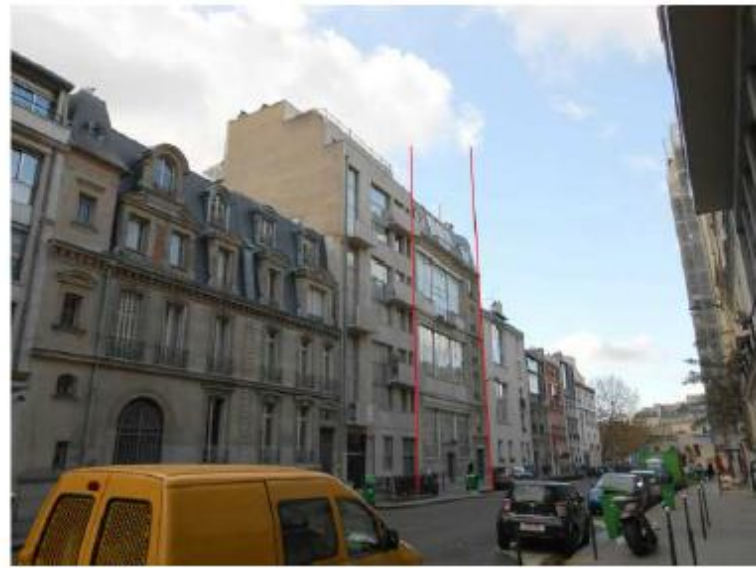
DP 8 - Photo de l'existant, vue lointaine