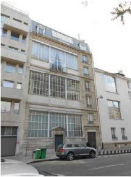
DP 7.1 - Photo de l'existant