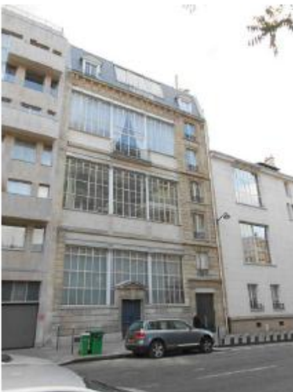
DP 6.1 - Photo du projet