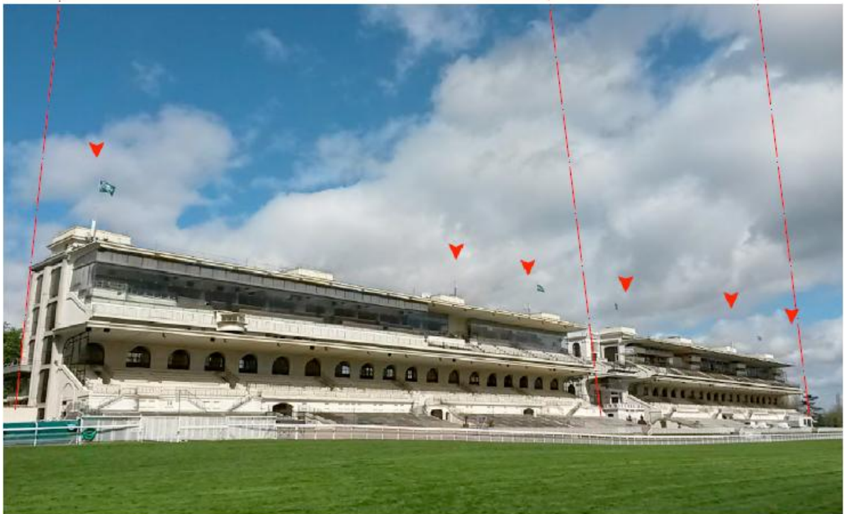
DP. 7.1. Photo. de l'existant