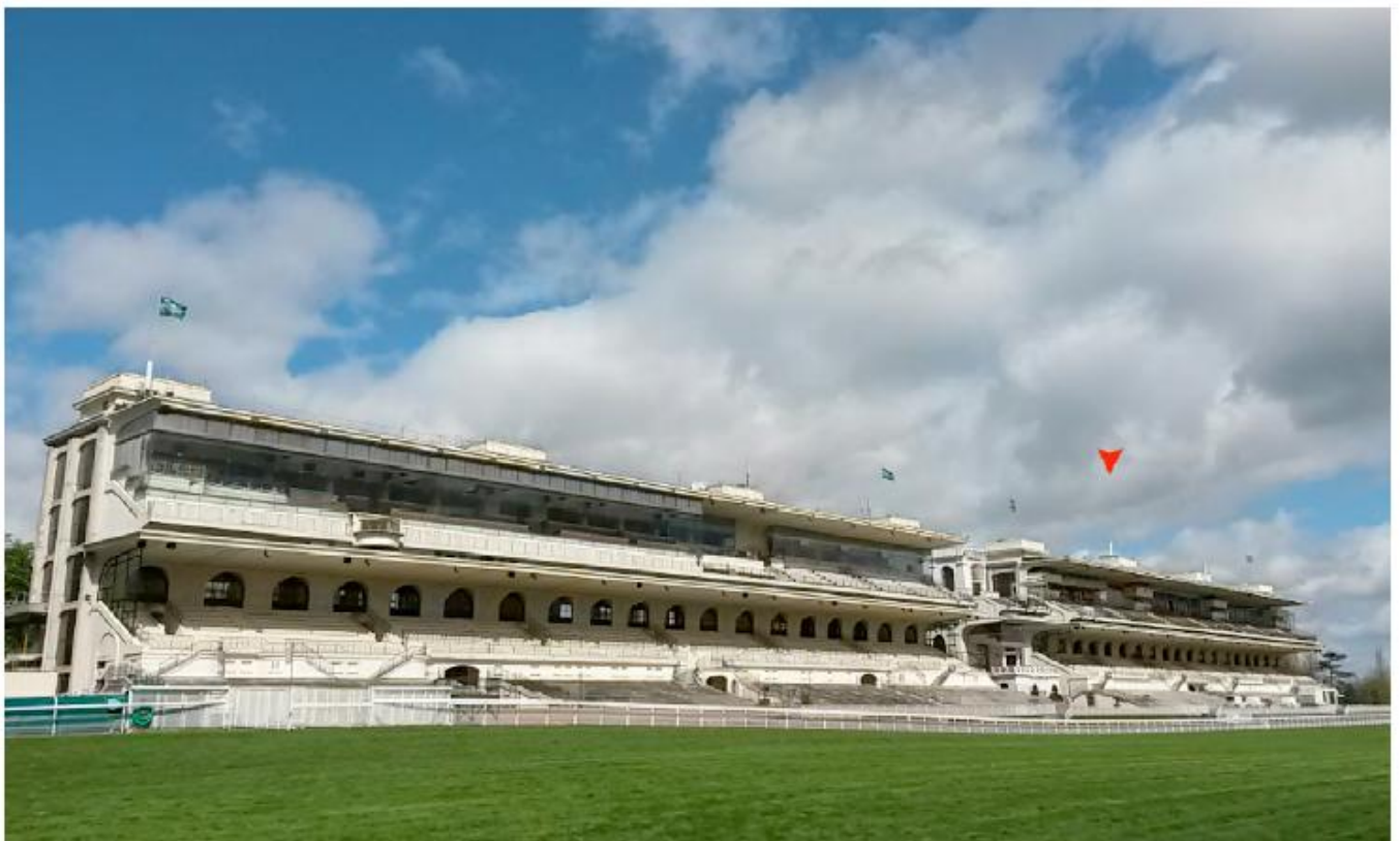
DP. 6.1. Photomontage. du. projet