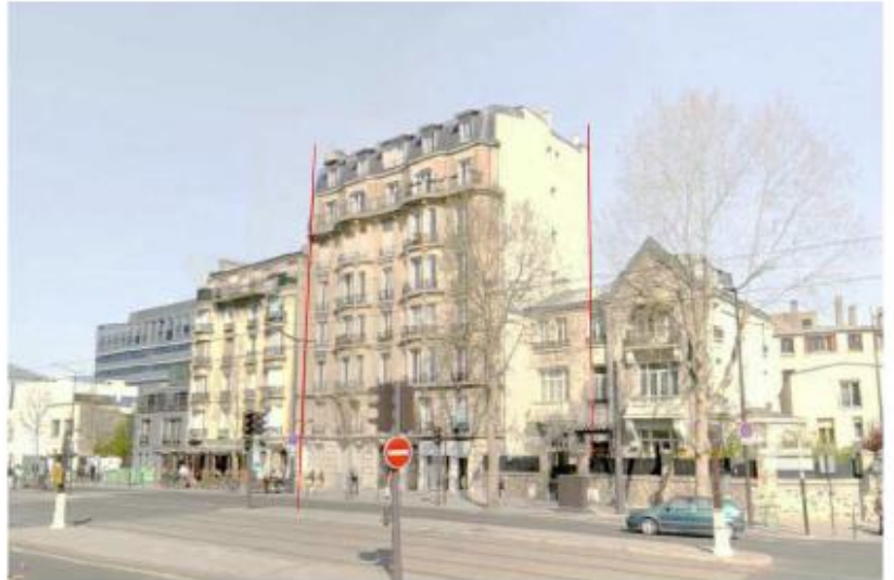
DP 8 - Photo de l'existant, vue lointaine