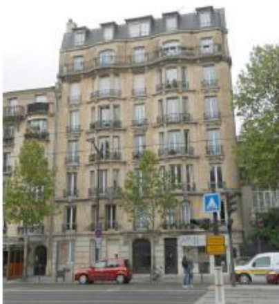
DP 6,1 - Photo du projet (Les antennes sont invisibles depuis ce point de vue)