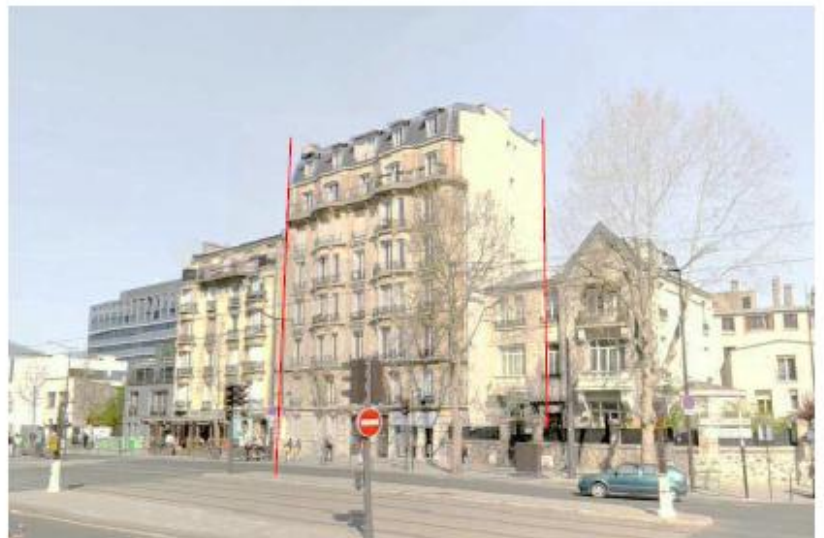
DP 8 - Photo du projet, vue lointaine