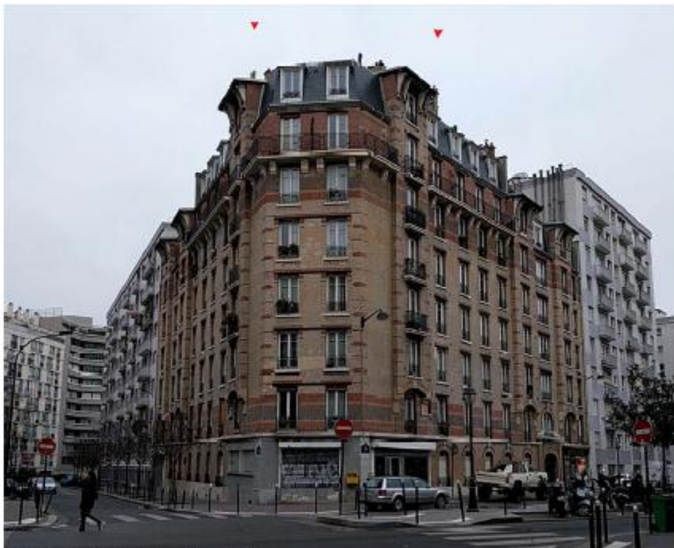
DP 6.1 Photomontage du projet