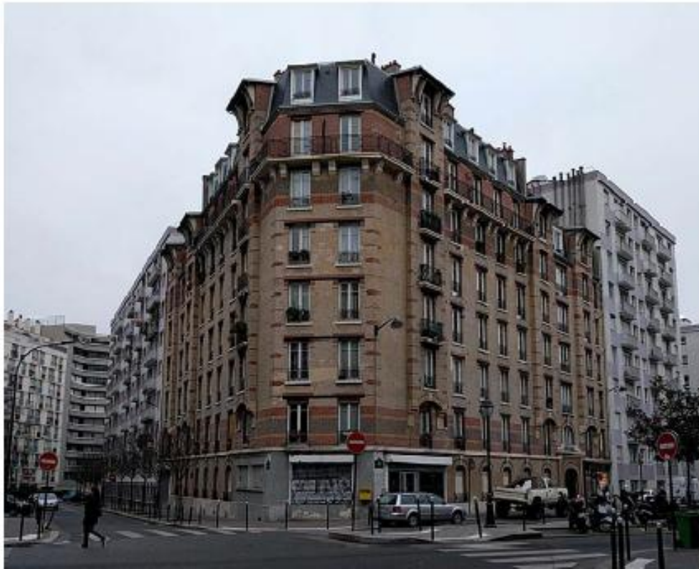
DP 7.1 Photo de l'existant