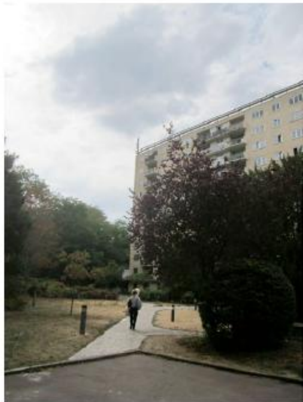
DP. 6.1. Photomontage du projet