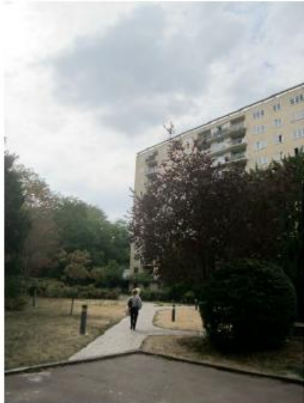
DP. 7.1. Photo. de l'existant