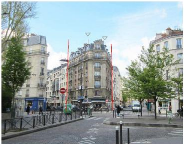
DP 8 - Photo du projet, vue lointaine