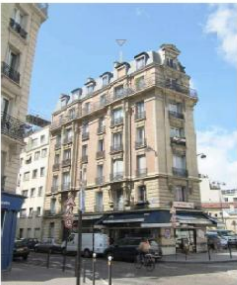
DP 6.1 - Photo du projet