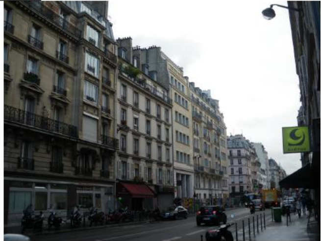
Etat de l'existant :