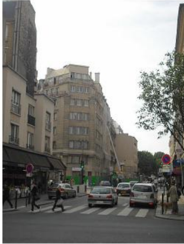
Etat de l'existant :