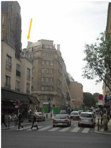
Etat projeté :