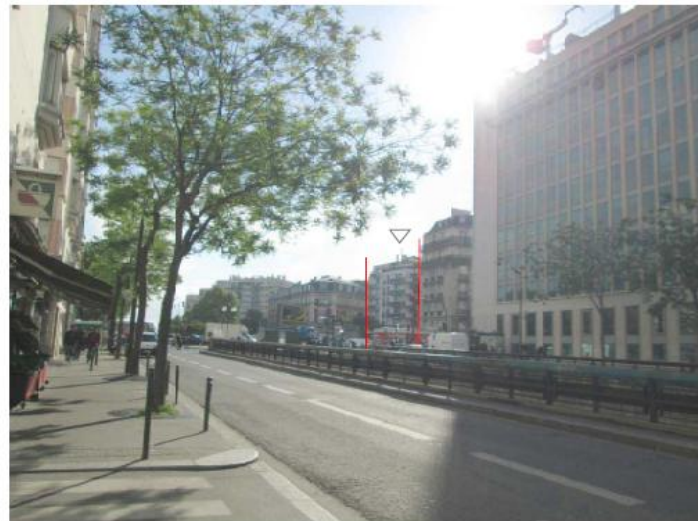
DP 8 - Photo du projet, vue lointaine