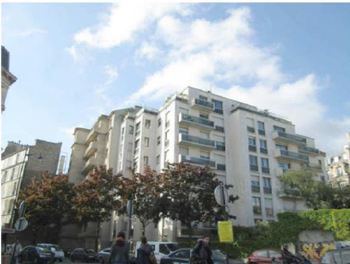
DP 6.1 - Photo du projet