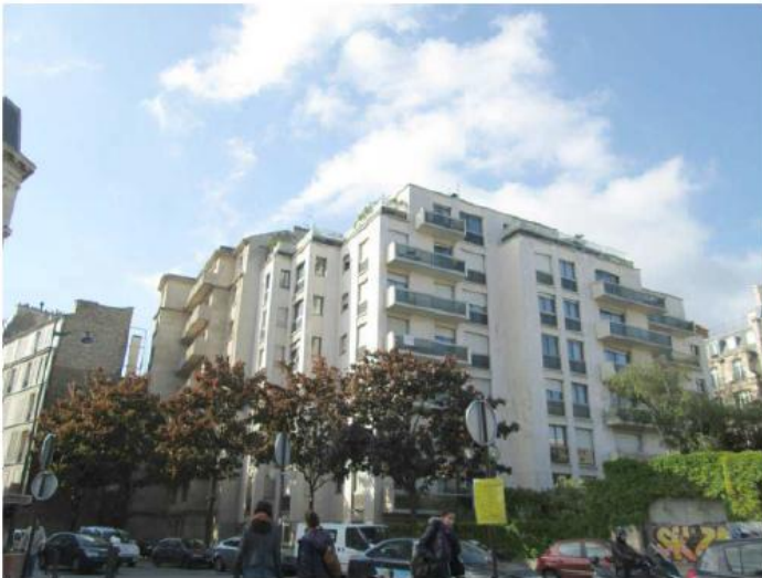
DP 7.1 - Photo de l'existant