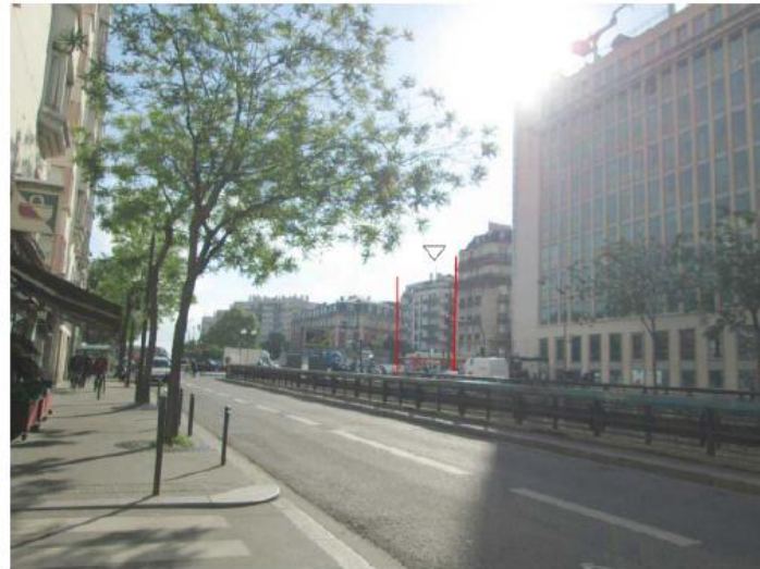
DP 8 - Photo de l'existant, vue lointaine