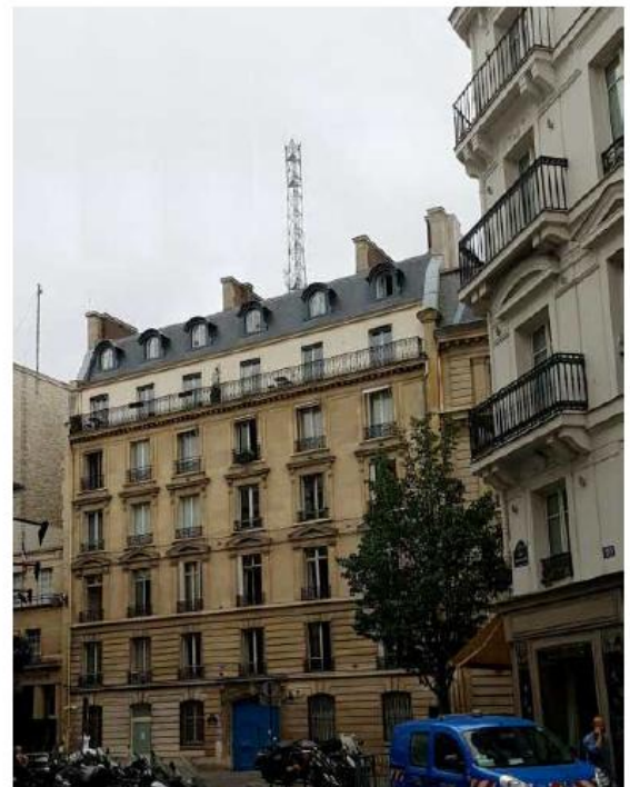
Photomontage du projet (les antennes n'e sont pas visibles depuis ce point de vue).