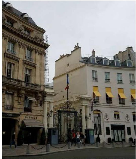
Photomontage du projet (les antennes n'e sont pas visibles depuis ce point de vue).