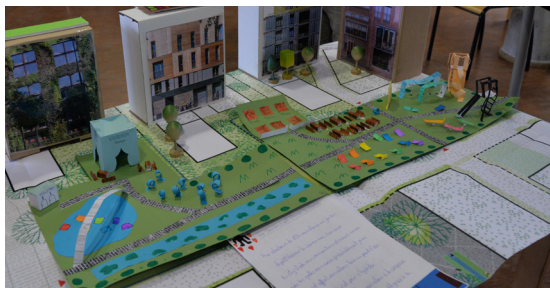
Une des maquettes réalisées par les élèves de la classe

ensuite participé à 2 séances pratiques où ils ont réalisé des maquettes en papier pour matérialiser leurs idées d'aménagement. Le 13 février, la classe présente l'ensemble des travaux à Espaces Ferroviaires et à l'architecte du projet.