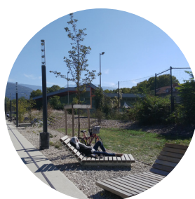
Des espaces publics ouverts sur le faisceau ferroviaire