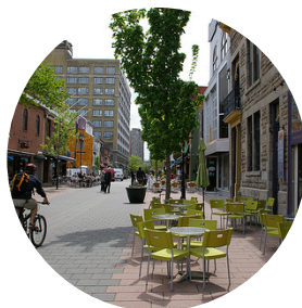
Un espace public lié aux rez-de-chaussées