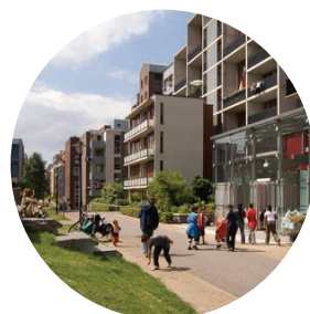
Des façades animées