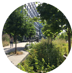
Des continuités piétonnes et une forte présence du végétal

Quelques références d'ambiances pour le quartier :