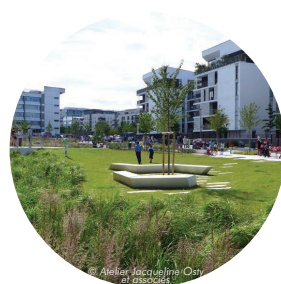
Un square en coeur de quartier