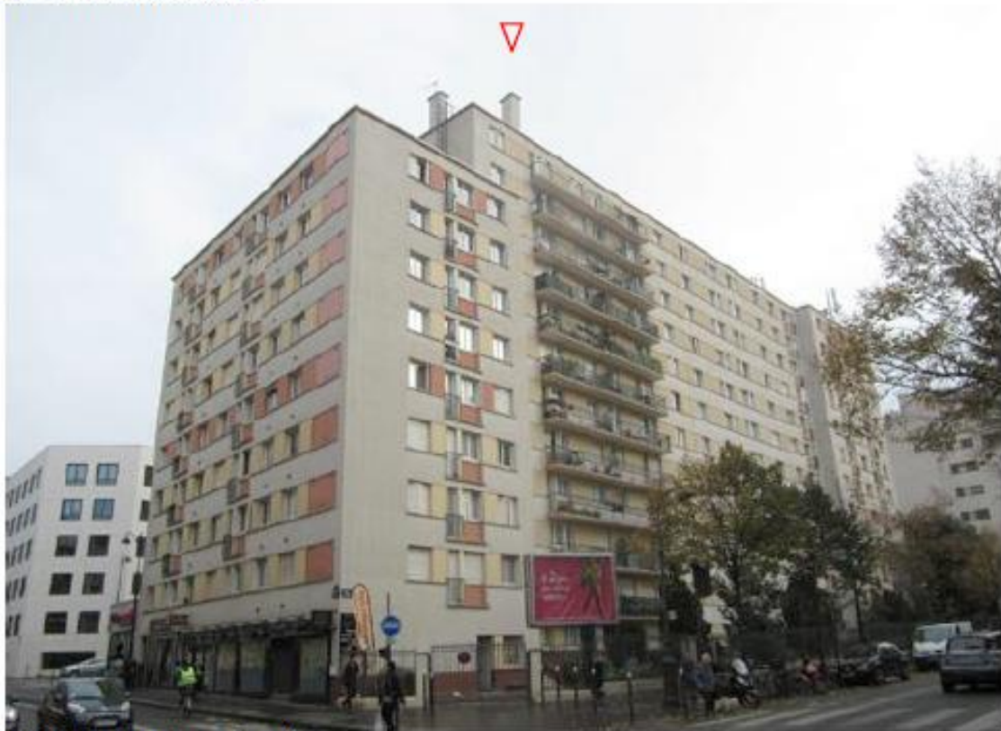
DP 6. Photomontage du projet.