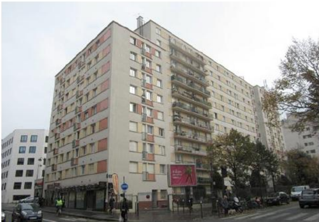
DP 7. Photo de l'existant