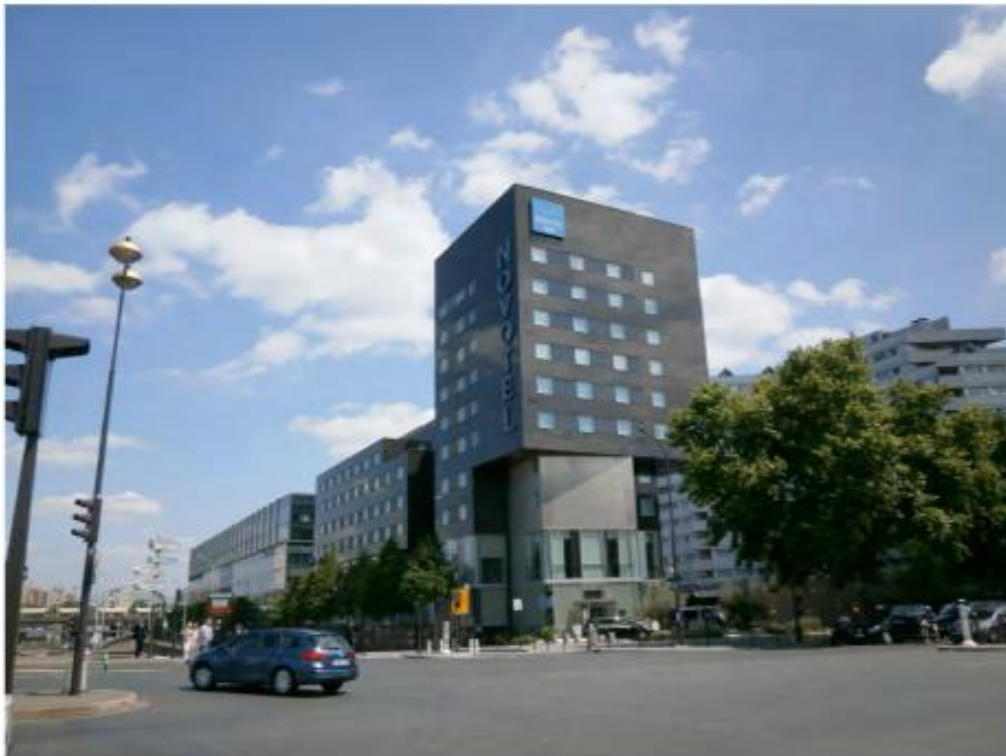
DP 7.1 Photo de l'existant