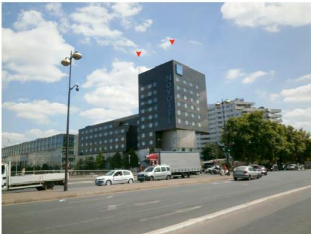
DP 6.1 Photomontage du projet