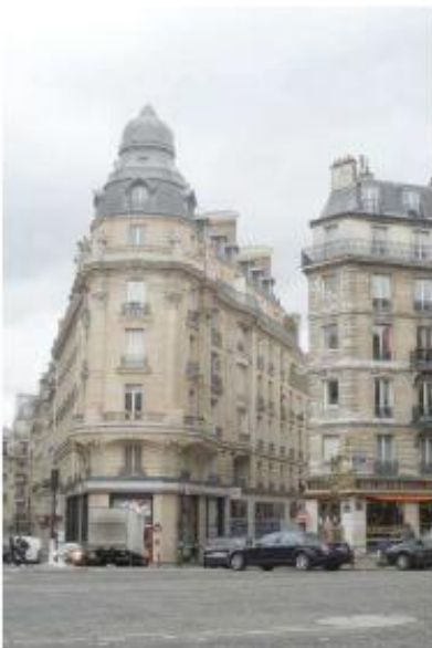
DP 6.1 - Photo du projet (Les antennes sont invisibles depuis ce point de vue)