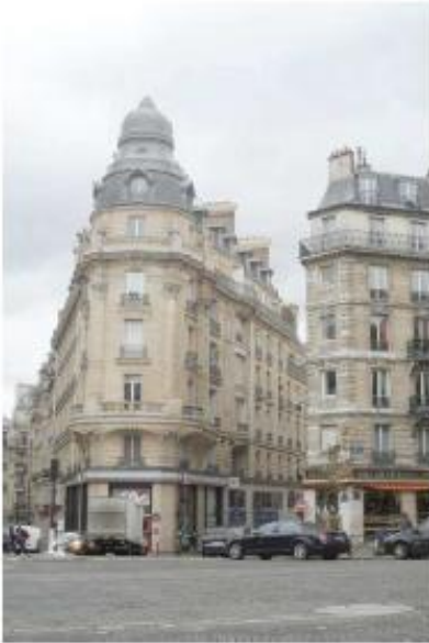
DP 7.1 - Photo de l'existant