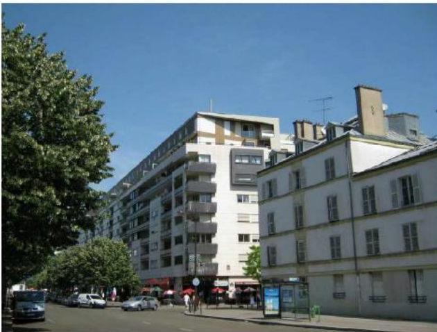
DP 6.1 - Photo du projet