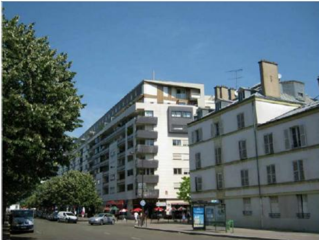
DP 7.1 - Photo de l'existant

REPLACEMENT À L'IDENTIQUE SANS IMPACT VISUEL