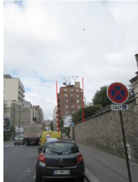
DP 8 - Photo de l'existant, vue lointaine