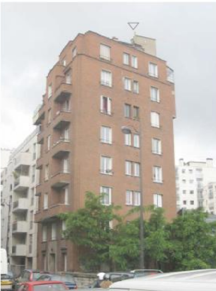
DP 6.1 - Photo du projet