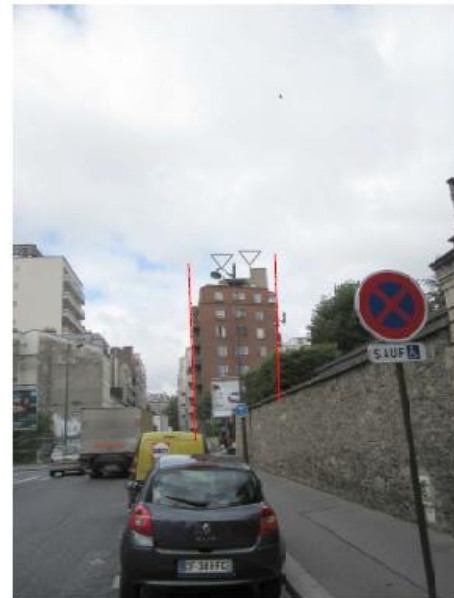
DP 8 - Photo du projet, vue lointaine