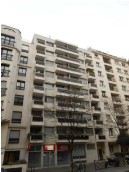
DP 7.1 - Photo de l'existant