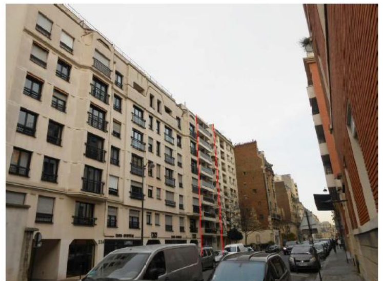
DP 8 - Photo du projet, vue lointaine