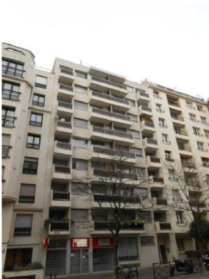
DP 6.1 - Photo du projet