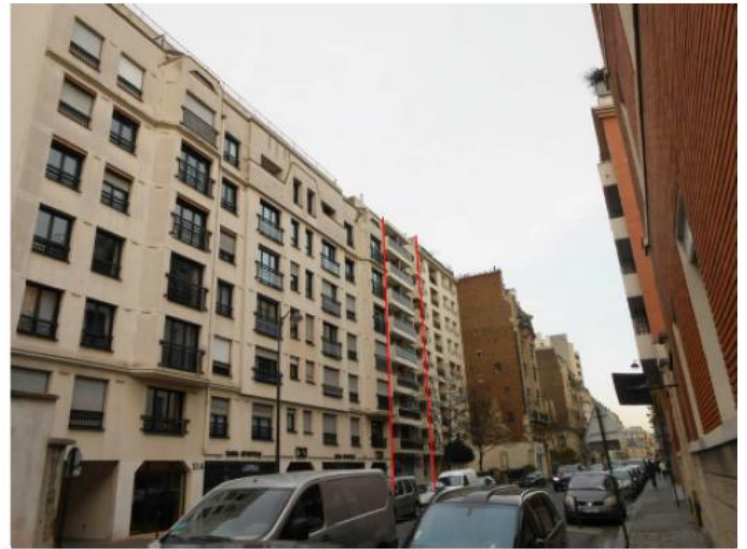
DP 8 - Photo de l'existant, vue lointaine