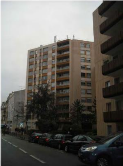
DP 7.1 - Photo de l'existant

REPLACEMENT À L'IDENTIQUE SANS IMPACT VISUEL