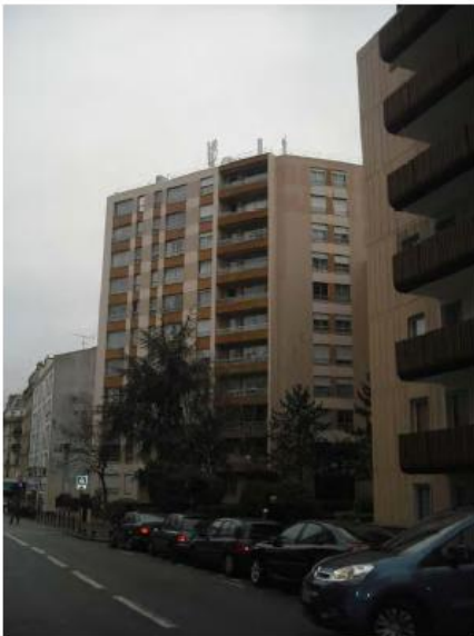
DP 6.1 - Photo du projet