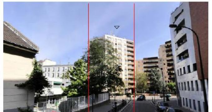
DP 8 - Photo du projet, vue lointaine