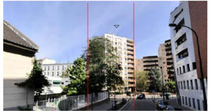
DP 8 - Photo de l'existant, vue lointaine