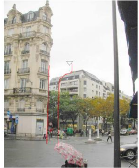
DP 8 - Photo de l'existant, vue lointaine