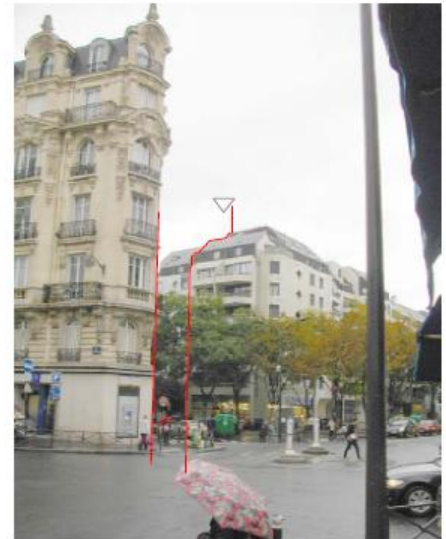
DP 8 - Photo du projet, vue lointaine