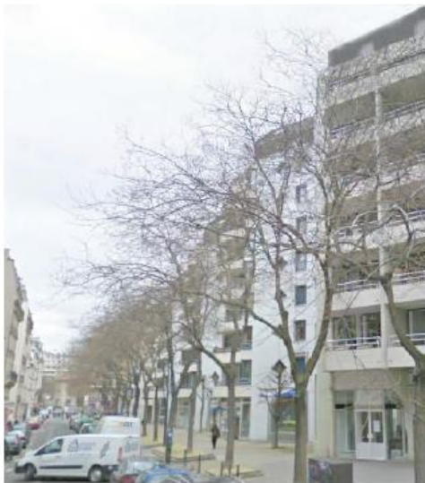
DP 6.1 - Photo du projet (L'antenne n'est pas visible depuis ce point de vue)