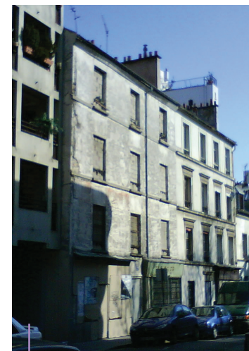
Vues de la façade de l'immeuble avant les travaux de réhabilitation

* Les énergies grises correspondent à la somme de toutes les énergies investies, de la conception à la destruction d'un matériau (extraction des matières premières, transformation, transport, recyclage...).