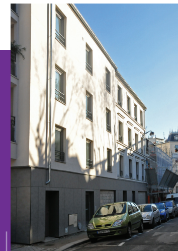
Vues de la façade de l'immeuble après les travaux de réhabilitation