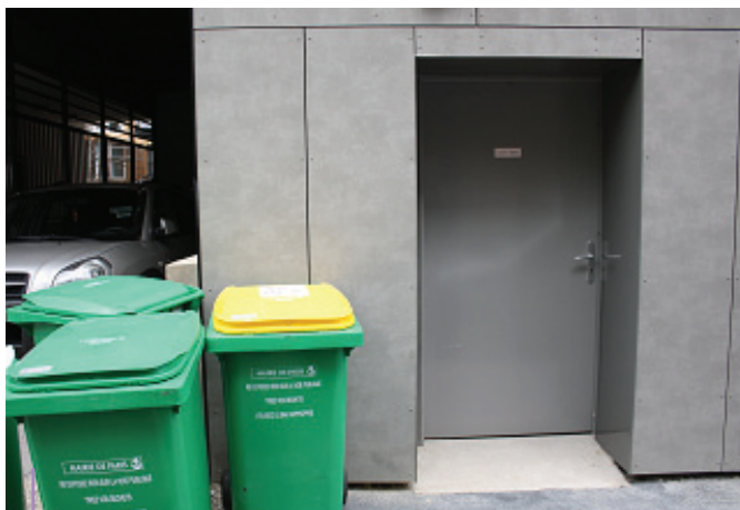
Vue de la porte du local sur la rue des Orteaux

Le local propreté doit comporter un certain nombre d'éléments qui permettent une bonne gestion des bacs et une bonne hygiène.