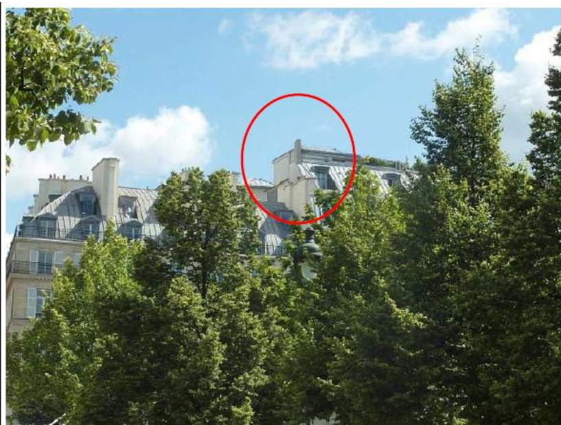
Photo prise avec du recul depuis le Jardin des Tuileries