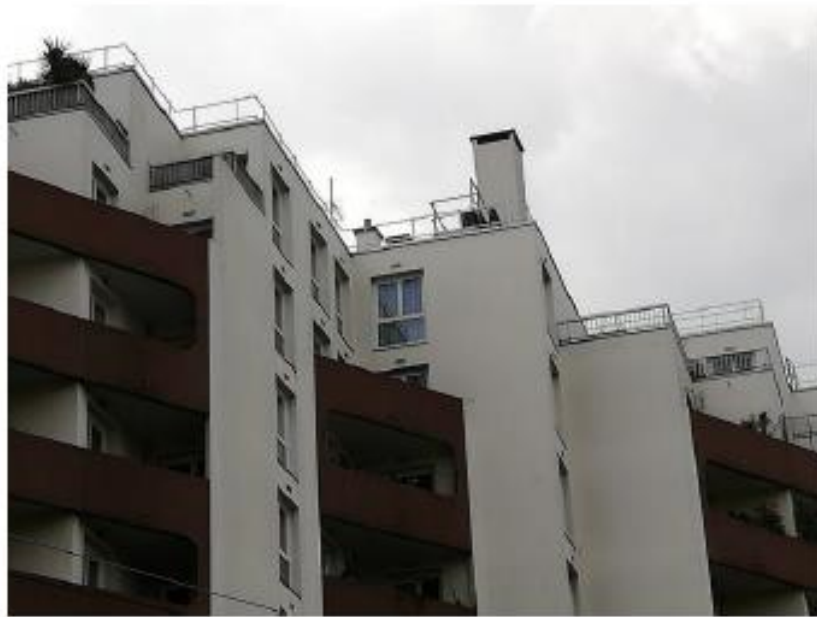
Photo du site vu depuis la rue