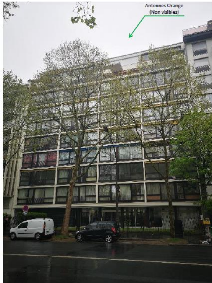
Etat projeté :