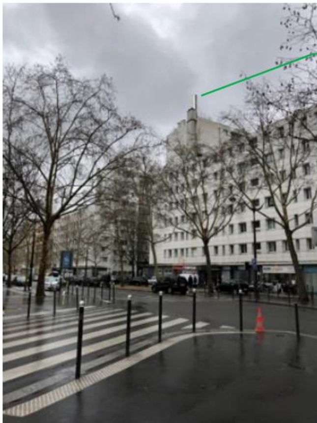
Etat projeté :