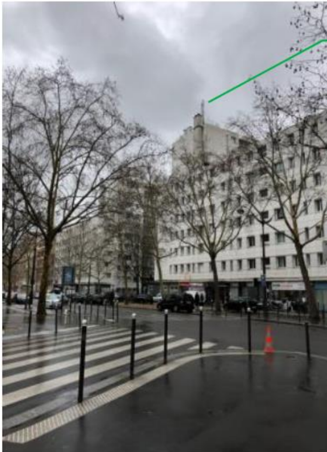
Etat de l'existant :