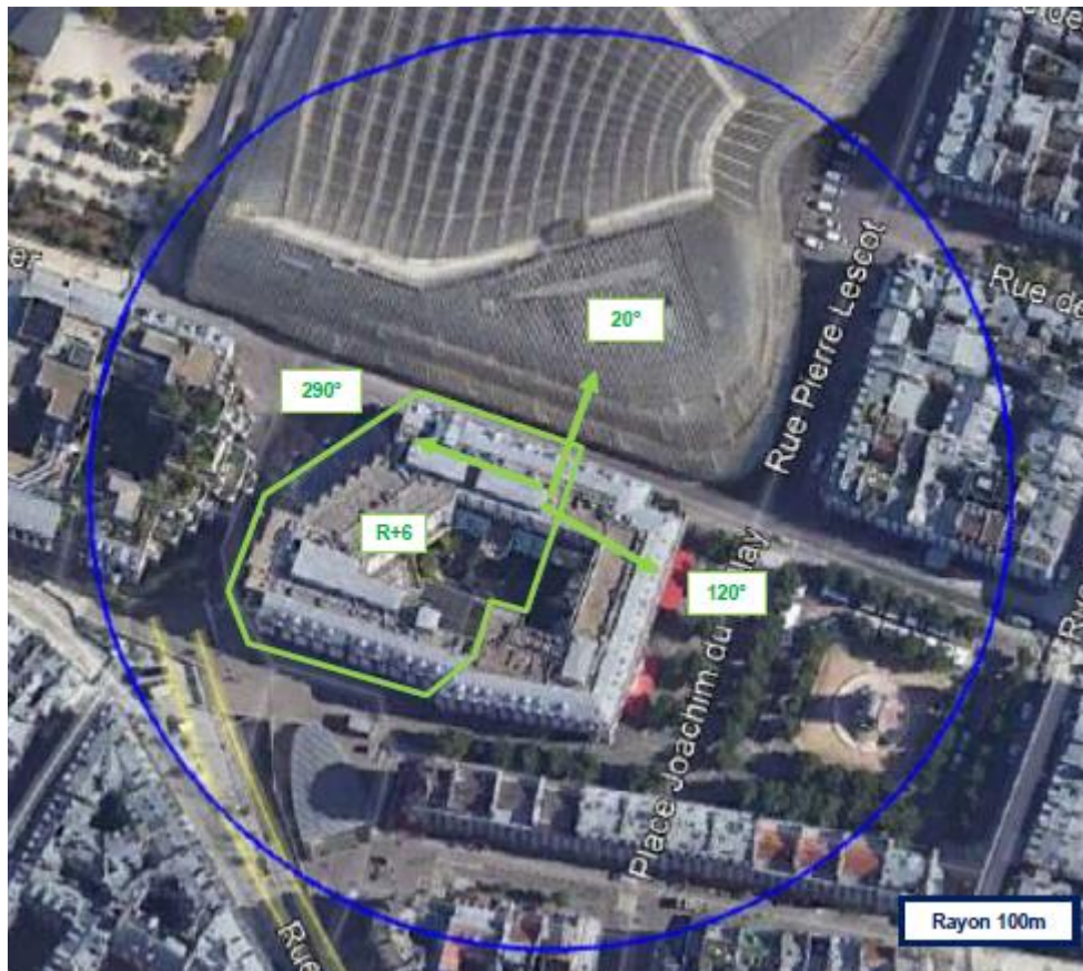
PAS D'ÉTABLISSEMENT PARTICULIER DANS UN RAYON DE 100M