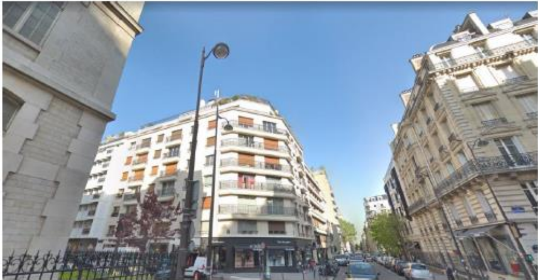
Photo du site vu depuis la rue