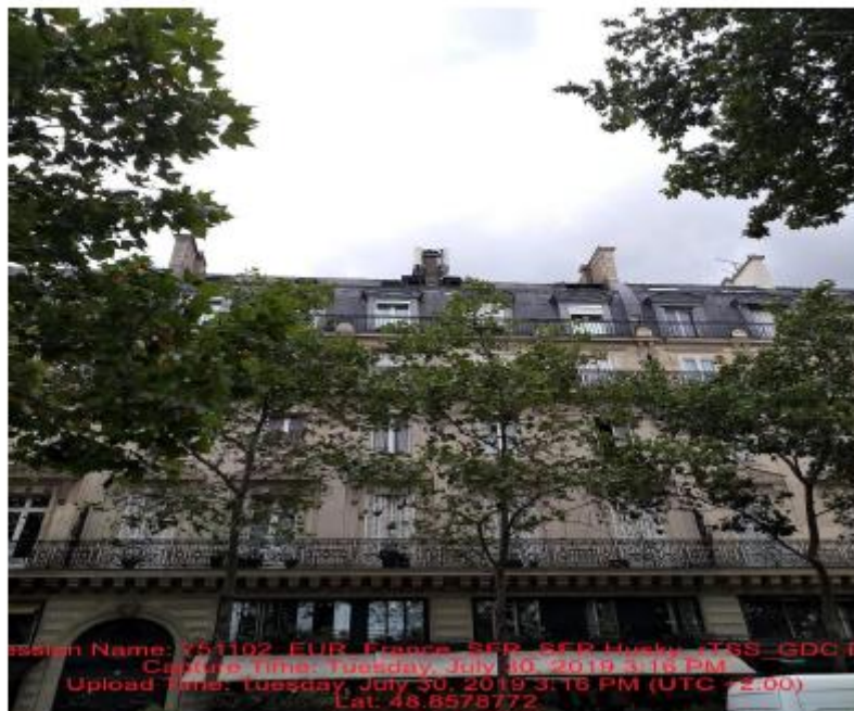
Photo du site vu depuis la rue