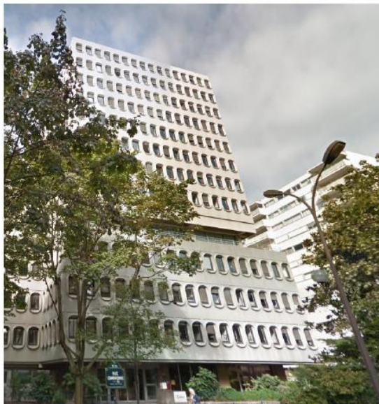
Photo du site vu depuis la rue