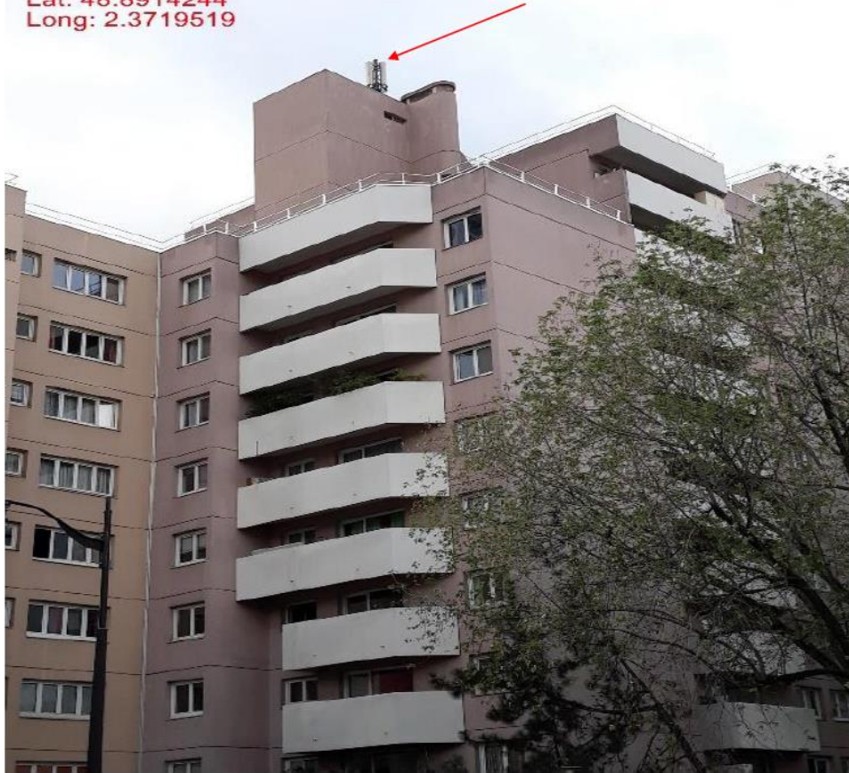
Vue des Azimuts

Session Name: PHOTO_2019_Paris_City_of_Paris_History_100 = 1 Capture Time: Monday, October 21, 2019 4:14 PM Upload Time: Monday, October 21, 2019 4:16 PM (UTC +2:00) Lat: 48.8914244 Long: 2.3719519