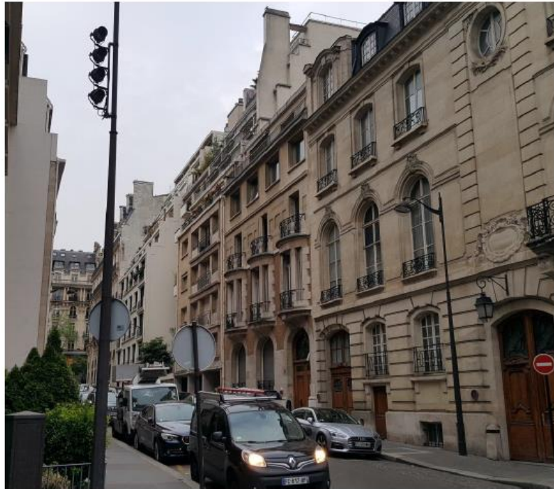
Etat de l'existant :