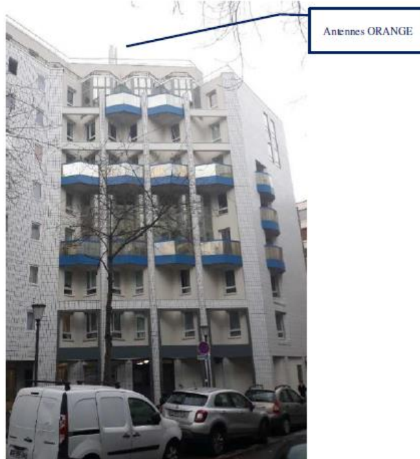
Etat projeté :