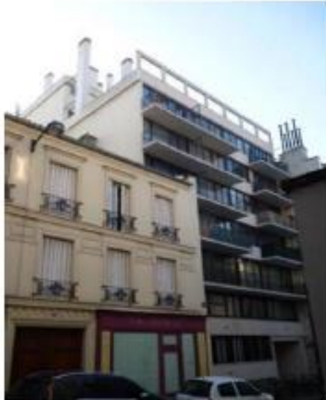
Etat projeté :