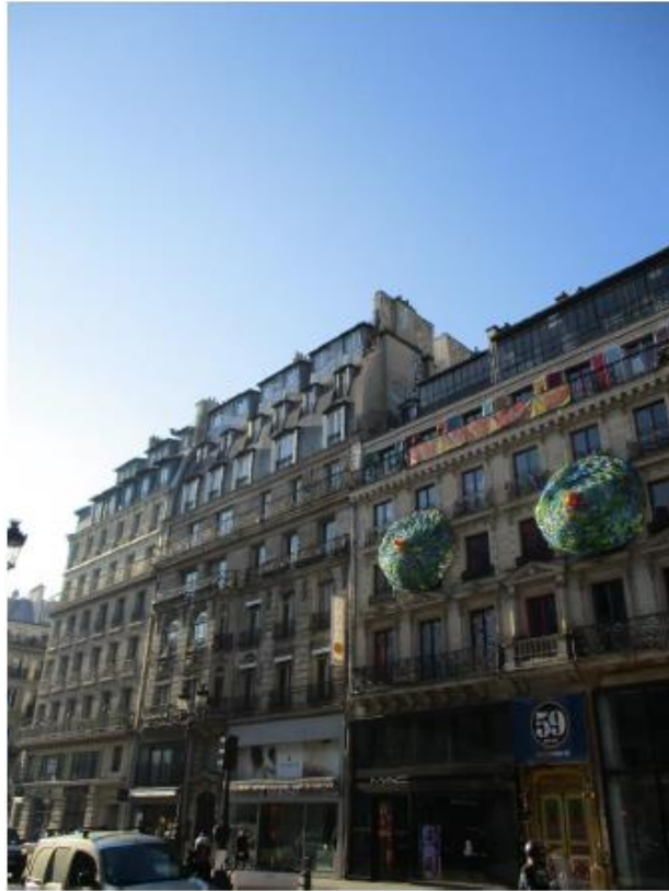
Etat projeté :