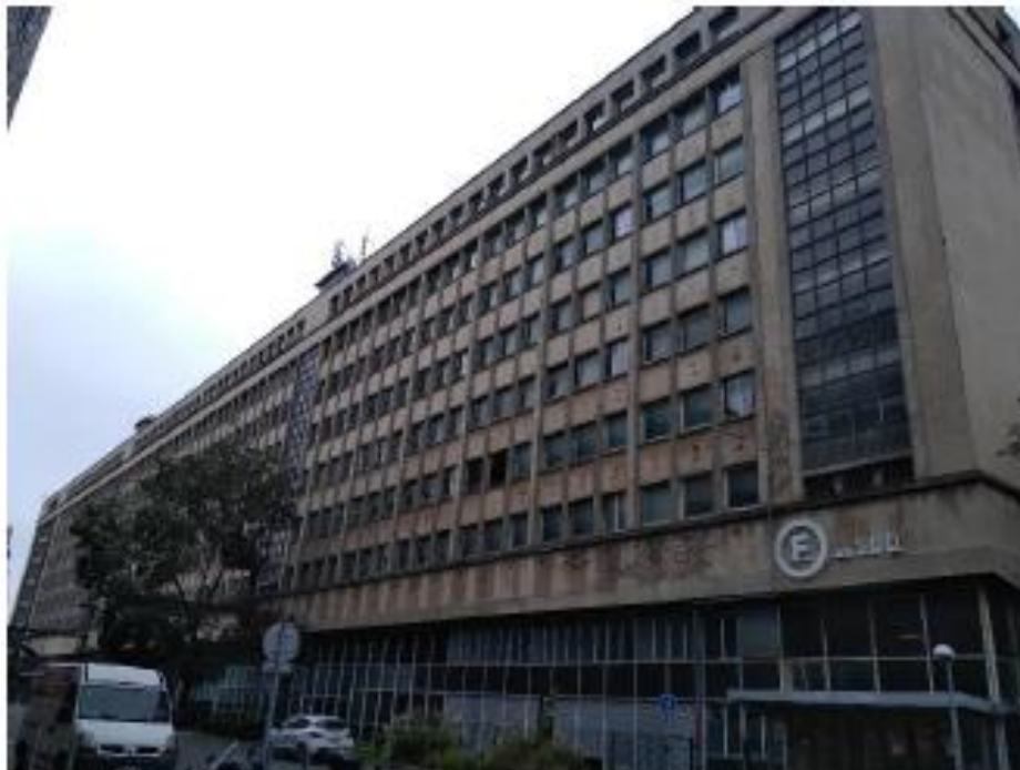
Etat projeté :