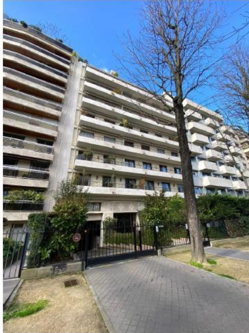
Etat projeté :