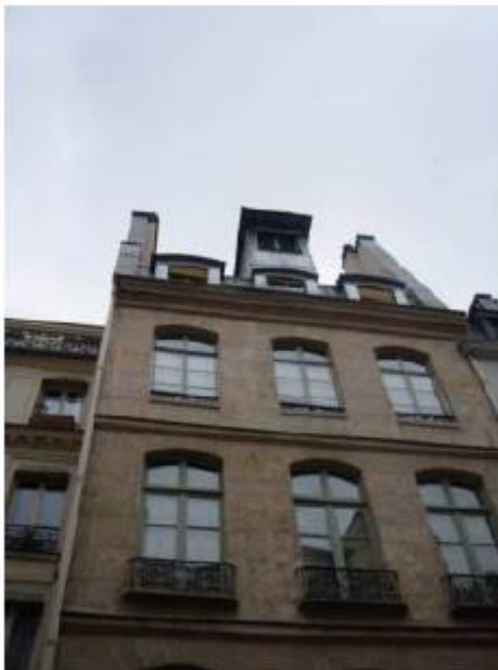
Etat projeté :