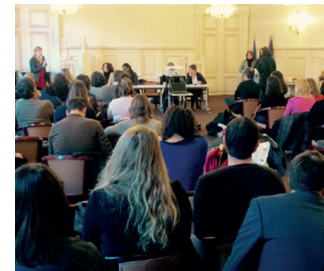
Réunion d'information sur les modes de garde dans le 9 e

Vous devez pré-enregistrer votre demande et prendre rendez-vous en ligne sur www.mairie9.paris.fr