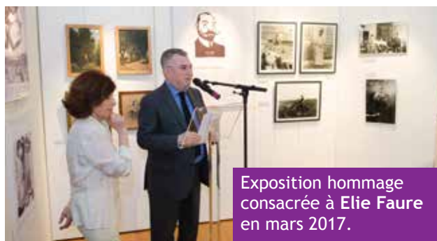
Exposition hommage consacrée à Elie Faure en mars 2017.