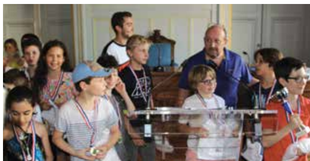
L'association Sport et loisirs 6 e remet chaque année une récompense à tous les jeunes joueurs de tennis.