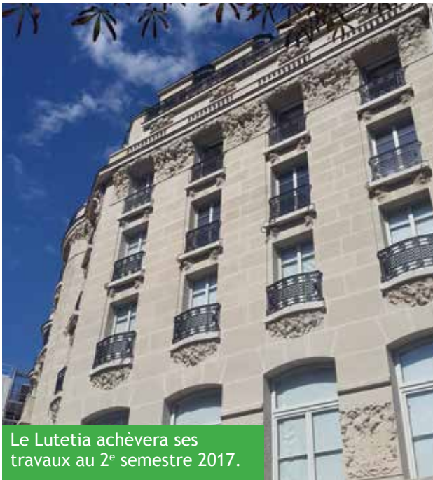
Le Lutetia achèvera ses travaux au 2 e semestre 2017.

Le projet MétaLmorphoses va permettre à la Monnaie de Paris d'ouvrir dès l'été 2017 un nouveau lieu de vie accueillant et ouvert sur la ville, autour d'une nouvelle offre culturelle qui présente des artistes contemporains à travers des expositions temporaires et des événements.