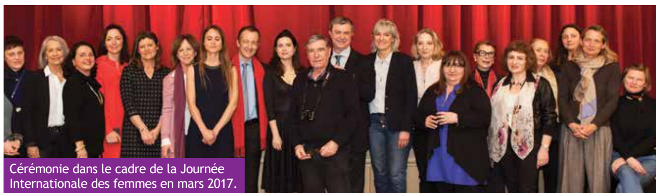
Cérémonie dans le cadre de la Journée Internationale des femmes en mars 2017.