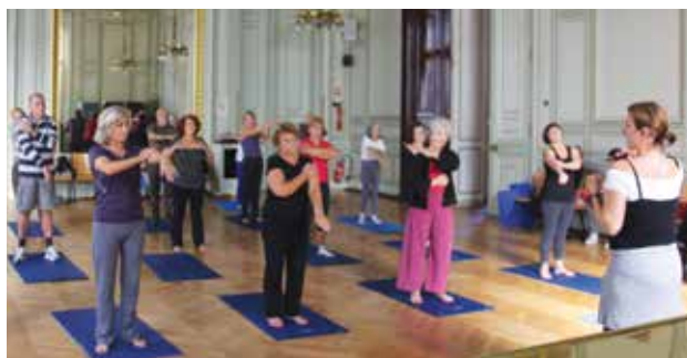
Dans le cadre de SENIORISSIMO, des ateliers de pilates ou de gym douce sont organisés à la Mairie du 6 e .