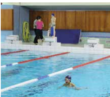
La piscine Saint-Germain fait régulièrement l'objet de travaux d'entretien et de mise aux normes.