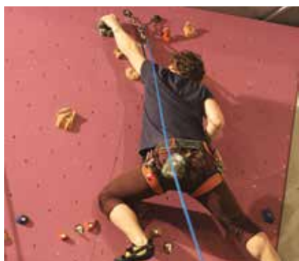
Un mur d'escalade a été construit au Lycée Montaigne en 2016.

De par la variété de ses équipements sportifs, et de leur bon entretien, la Mairie du 6 e veille à ce que les nombreuses associations présentes dans l'arrondissement puissent proposer leurs disciplines dans des conditions optimum.