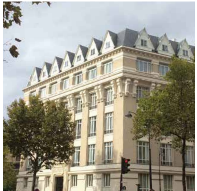
En septembre 2015, la résidence du 93 boulevard du Montparnasse a ouvert : 110 logements pour étudiants, jeunes travailleurs et personnes handicapées.