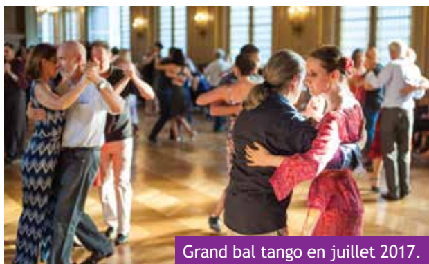
Grand bal tango en juillet 2017.