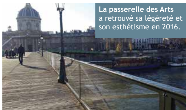
La passerelle des Arts a retrouvé sa légèreté et son esthétisme en 2016.