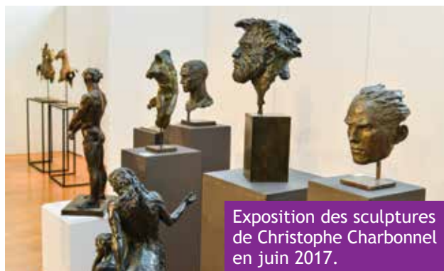
Exposition des sculptures de Christophe Charbonnel en juin 2017.

Chaque année depuis 9 ans, le Salon d'art floral présente durant 3 jours de magnifiques compositions.