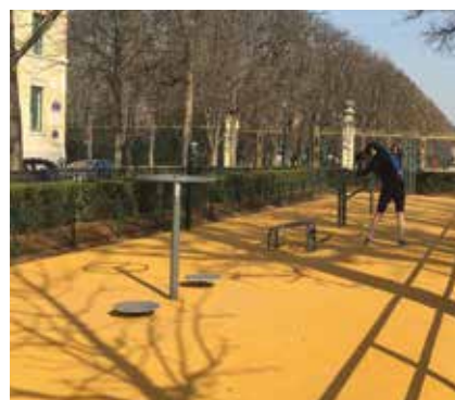
Plusieurs agrès ont été installés en 2016 dans le jardin des Grands Explorateurs.

Les Courses du Luxembourg sont organisées tous les ans en septembre autour du jardin du Luxembourg.