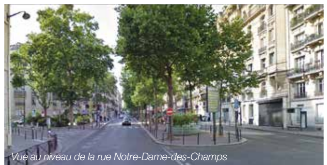
Vue au niveau de la rue Notre-Dame-des-Champs

Un CICA (Comité d'Initiative et de Consultation d'Arrondissement) qui rassemble les élus du 6 e et l'ensemble des responsables d'associations, a eu lieu le 22 mars dernier au cours duquel