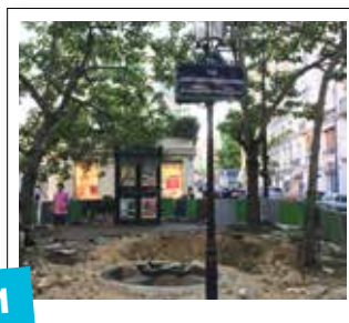
1 Réfection du sol de la place Laurent Terzieff et Pascale de Boysson / 185 000 €