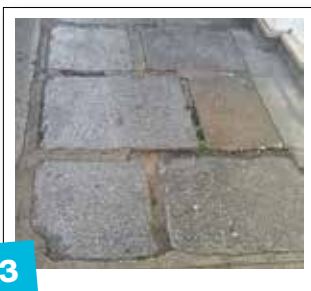
3 Réfection des trottoirs du 6 e / 100 000 €