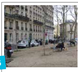
5 Création d'un parc canin place Camille Jullian / 25 000 €