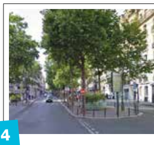
4 Aménagement du boulevard Raspail 2 e partie / 400 000 €