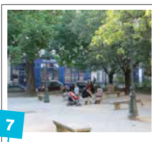
7 Installation d'un module de jeux pour enfants square Gabriel Pierné / 20 000 €