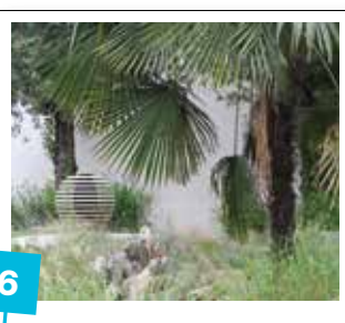
6 Remise en eau de la fontaine de Lartigue square Scheurer-Kestner rue Jacob / 15 000 €