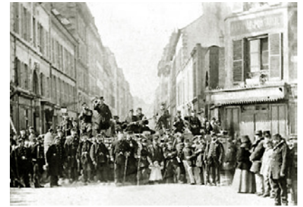
Barricade, rue Saint-Sébastien, XI ème , 1871.