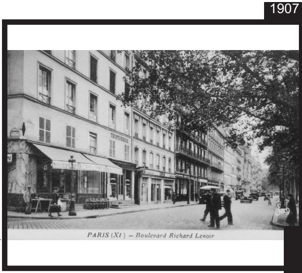
PARIS (XI) - Boulevard Richard Lenoir

1 c'est le nombre de poissonnerie ayant façade sur rue dans notre quartier !