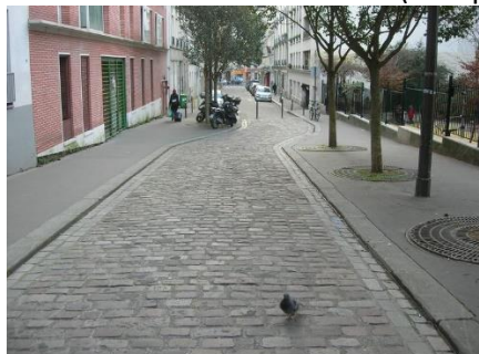
Vers Bd Voltaire