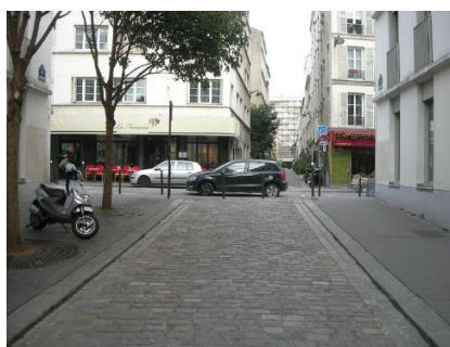
Vers rue Léon Frot