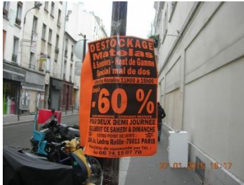
Nouvelle campagne d'affichage sauvage depuis le 27/01/15...

- Amende affichage politique et/ou commercial : Régulièrement nous pouvons découvrir des campagnes d'affichage sauvage, les contrevenants (sociétés commerciales ou partis politiques) sont-ils réellement poursuivis et sanctionnés ?