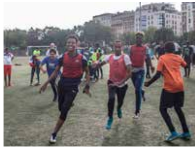
L'après-midi, le tournoi des partenaires a été remporté par les jeunes du centre Paris Anim' Maurice Ravel, dans un très bon état d'esprit.