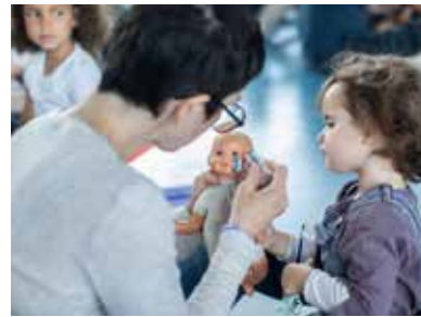
Ces journées permettent de passer de bons moments en famille.