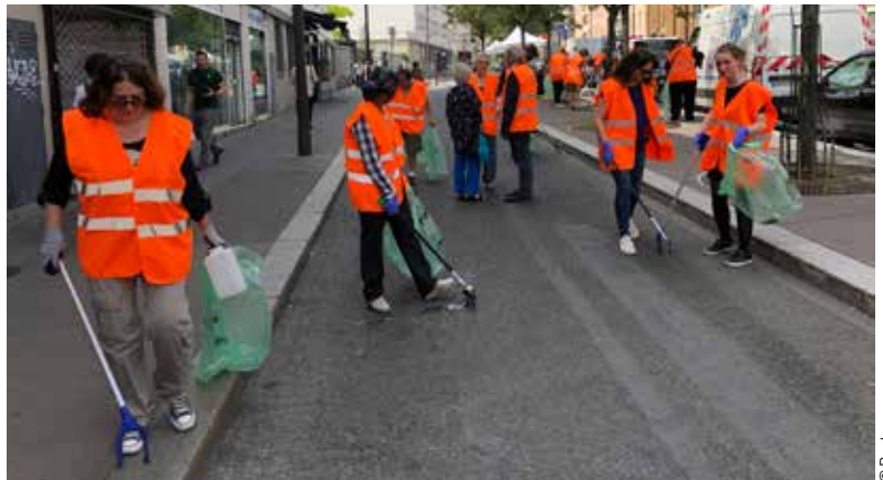
Le 9 juin dernier, les habitants du 12 e ont participé à l'opération du Grand nettoyage organisé par la Ville de Paris.

C'est grâce à la mobilisation de toutes et tous que nous améliorerons durablement la propreté de Paris ! Afin de sensibiliser et d'associer les habitants à ces enjeux, la Mairie a convié les représentants des Conseils de quartier à une Conférence-débat au mois de mai dernier. Suite à ces échanges, qui ont notamment permis