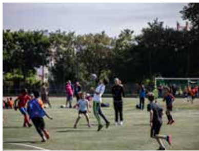
La journée commence avec les tournois des enfants et des jeunes des clubs de foot de l'arrondissement.

Samedi 16 juin, pour l'entrée en lice de l'équipe de France en Coupe du monde, le stade Léo Lagrange s'est transformé en haut lieu du football. La « CAM ZONE », organisée par La Camillienne, la Mairie du 12 e et de nombreux partenaires a réuni près de 700 amoureux du ballon rond, dont 450 enfants. Une réussite !