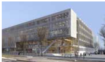
Esquisse du projet présenté en 2015.

Les travaux auraient dû démarrer à l'été 2017