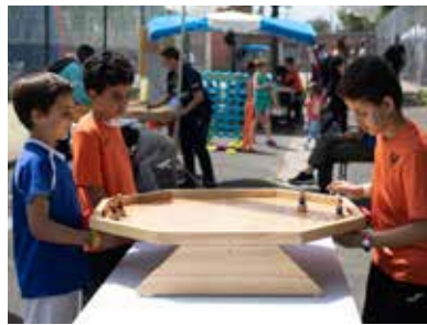
Des stands maquillage et diverses animations ont rythmé la journée.