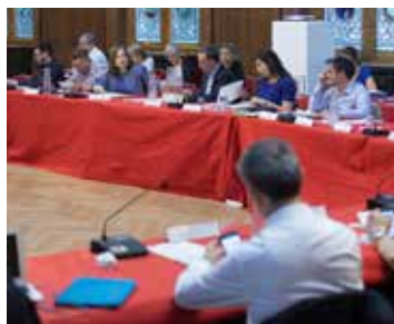
Les élus du 12 e continueront à interroger la Région et l'État sur leurs projets pour cet établissement.

Pour mémoire, le projet de reconstruction du lycée a été voté et financé par le Conseil Régional en 2015. Il s'élève à 56 millions d'euros. Il aurait dû accueillir les élèves dès la rentrée 2019.