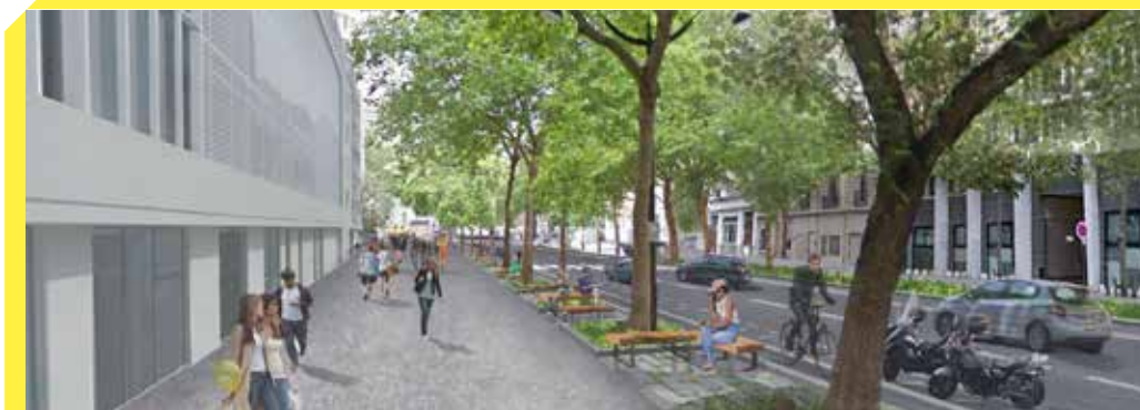
Principe d'aménagement de l'avenue de Saint-Mandé, à hauteur de la nouvelle université Paris III.

Le projet d'aménagement de l'avenue de Saint-Mandé a fait l'objet d'un important processus de concertation lancé en 2017 avec les riverains de l'avenue. Il a, par la suite, été présenté en réunion publique le 7 novembre 2018. Une lettre d'information a été distribuée aux habitants fin juin 2019, un mois avant le début des travaux. La première phase de travaux est maintenant terminée, la deuxième se déroulera jusqu'en janvier 2020, et les deux dernières s'achèveront mi-mars 2020.