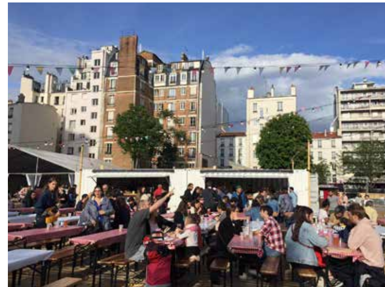
Le "marché pop" vous accueille au 77 av. du Docteur Arnold Netter jusqu'au 15 octobre 2019.

Les 11-18 ans sont également accueillis pour des activités gratuites au stade Alain Mimoun dans le cadre du dispositif Ville-Vie Vacances.