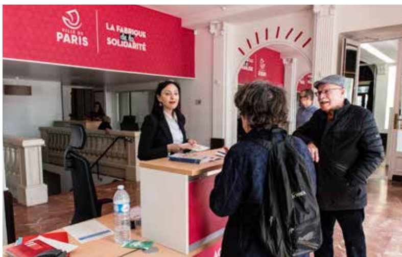
La Fabrique de la Solidarité accueille les bénévoles parisiens au 98 quai de la Râpée

Dès la première Nuit de la Solidarité, les Parisiens ont été très nombreux à exprimer leur souhait de s'engager davantage auprès des sans-abri. Pour les accompagner dans leur démarche, la Ville a créé un lieu dédié aux bénévoles et aux associations. La Fabrique de la Solidarité vient d'ouvrir ses portes dans le 12 e .