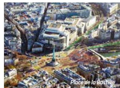
Place de la Bastille

Depuis le 18 juin, la circulation est définitivement modifiée afin de créer une presque île entièrement dédiée aux piétons et aux mobilités douces qui s'étend sur plus de 11 000m 2 , de la colonne de juillet jusqu'à l'esplanade du port de l'Arsenal. La place de la Bastille permet ainsi de croiser la trame verte avec la Coulée verte depuis Vincennes et la trame bleue avec le fleuve. Les nouvelles traversées piétonnes, sont raccourcies et plus accessibles. Les cheminements cyclables sont développés pour favoriser davantage les déplacements doux.