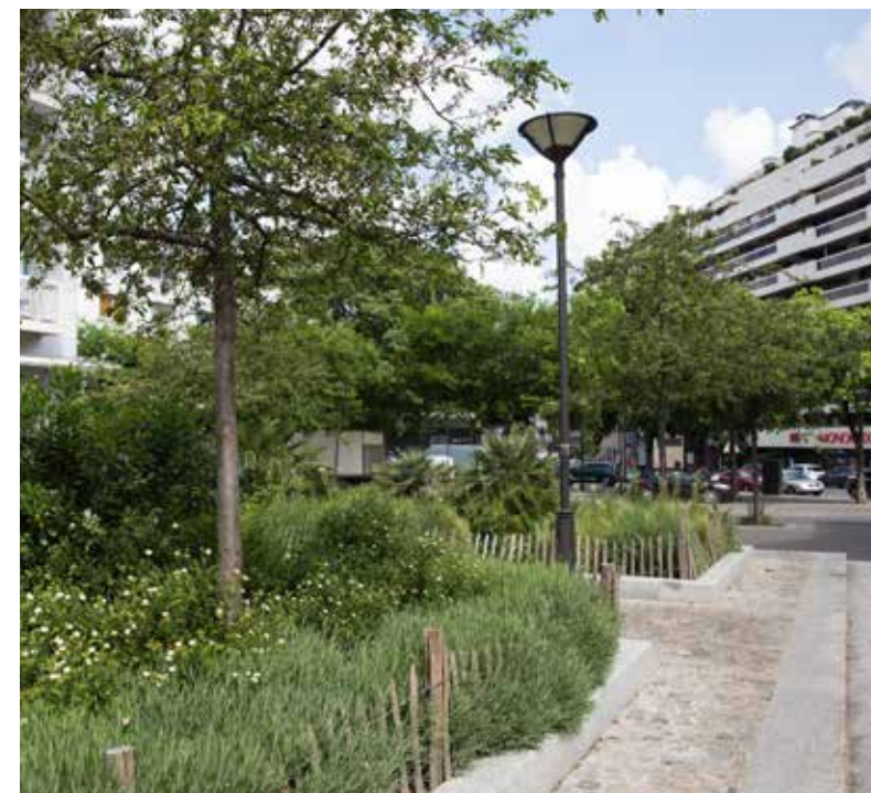
Le budget participatif a permis aux habitants du 12 e de végétaliser une promenade jusqu'au Jardin de Reuilly.

+ d'info : democriatelocale.mairie12@paris.fr