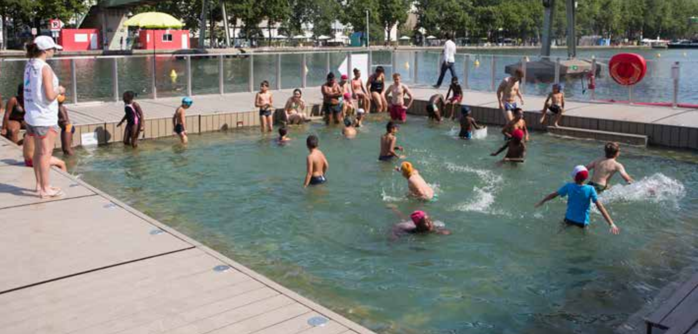
À l'image de celui de la Villette, le bassin du centre sportif Léo Lagrange est gratuit et ouvert à tous jusqu'au 1 er septembre.