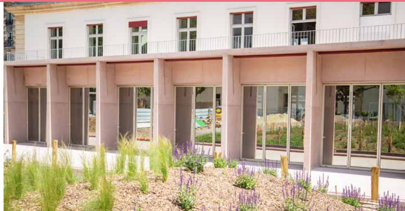
Une crèche, des commerces, des « halles gourmandes » et un cabinet médical accueilleront progressivement les habitants du 12 e .

Ce « morceau de ville » est à l'image du Paris que nous construisons, du Paris que nous voulons. Avec Paris Habitat, nous avons créé près de 600 logements, accessibles à une très grande majorité de Parisiens au sein d'un écrin patrimonial préservé, agrémenté d'un grand espace vert, offrant de nouveaux services publics de la petite enfance, des médecins, des commerces, un grand jardin et de l'agriculture urbaine... Ce projet est exemplaire, dans ses dimensions sociales et environnementales. Je vous invite à venir en profiter dès cet été et à nous retrouver le 24 août prochain pour l'inauguration du jardin Martha Desrumaux autour d'un grand pique-nique participatif. »