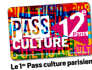
Le 1 er Pass culture parisien

Pour bénéficier des offres du pass culture : envoyer un mail en joignant votre justificatif de domicile et une pièce d'identité à culturel12@paris.fr