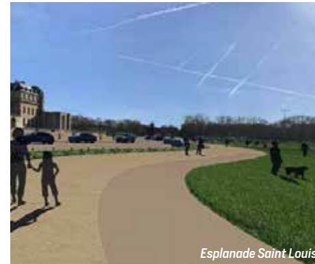
Esplanade Saint Louis

Parvis situé devant le Château de Vincennes, l'esplanade Saint-Louis est en travaux jusqu'en décembre. Le projet consiste à réduire l'emprise de la voiture au nord de l'esplanade, à végétaliser la partie centrale par une prairie et à créer deux allées piétonnes et une piste cyclable au nord. Nouvelle porte d'entrée végétale du Bois de Vincennes, la création de cette "prairie" représente