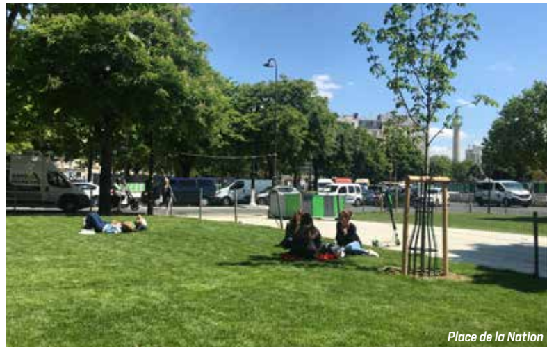
Place de la Nation