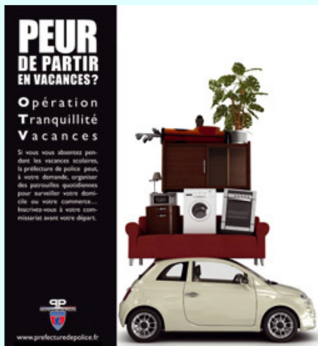
L'affiche réalisée par la Préfecture de Police pour la campagne OTV.

Commissariat central du 16 e : 62, avenue Mozart, 01 55 74 50 00.