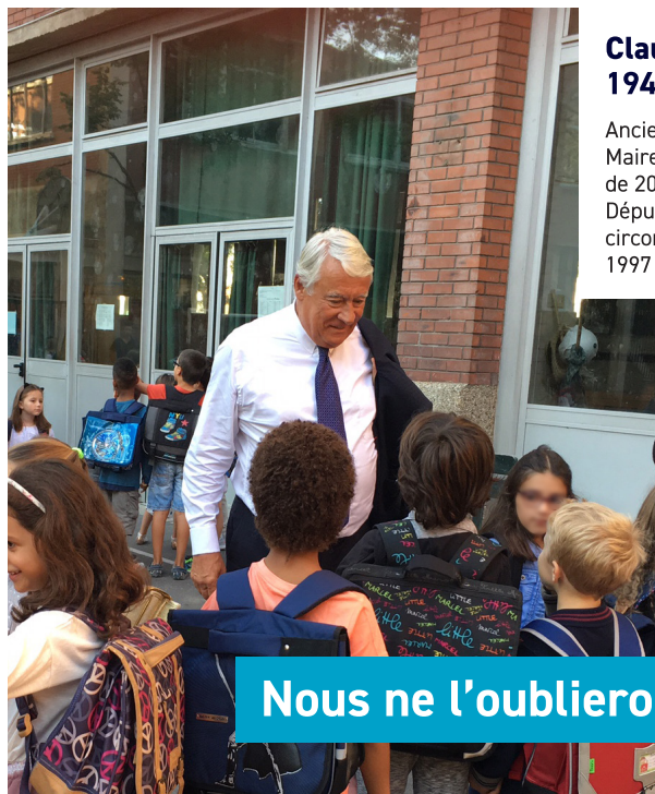
Claude GOASGUEN 1945 -2020

Ancien Ministre Maire du 16 e arrondissement de 2008 à 2017 Député de la 14 e circonscription de Paris de 1997 à 2020