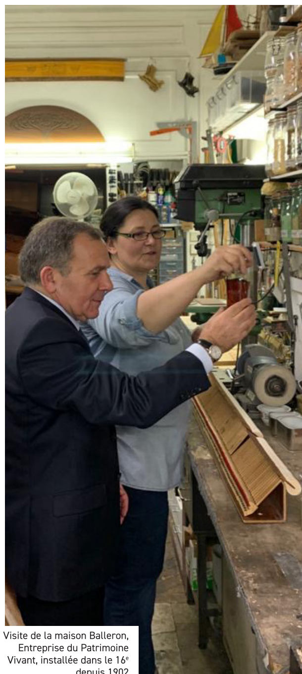
Visite de la maison Balleron, Entreprise du Patrimoine Vivant, installée dans le 16 e depuis 1902