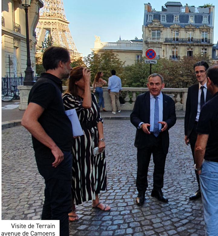
Visite de Terrain avenue de Camoens