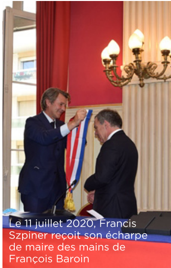
Le 11 juillet 2020, Francis Szpiner reçoit son écharpe de maire des mains de François Baroin

Il faut arrêter de laisser dire que le 16 e est épargné par la délinquance et les violences urbaines. Les chiffres sont malheureusement explicites. Entre 2019 et 2020, les atteintes aux personnes ont progressé deux fois plus dans le 16 e (+16,8%) que dans l'ensemble de la capitale (+8,16%). Il faut relever la nouvelle forte croissance des cambriolages (+12,3% dans le 16 e contre +3,12% dans Paris), qui avait déjà augmenté de 16% dans notre arrondissement en 2018. Les aprioris politiques perdurent concernant le 16 e , jugé « tranquille » et « privilégié ». C'est un quartier effectivement tranquille et privilégié. Mais il doit le rester ! La première chose que j'ai faite en tant que Maire a donc été de rencontrer le Préfet de Paris, Didier Lallement et le Commissaire de Police de l'arrondissement.