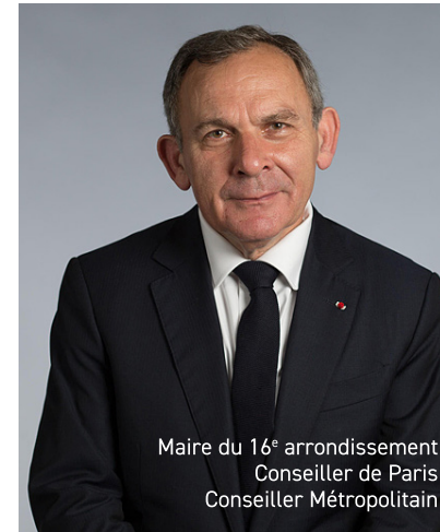
Maire du 16° arrondissement Conseiller de Paris Conseiller Métropolitain