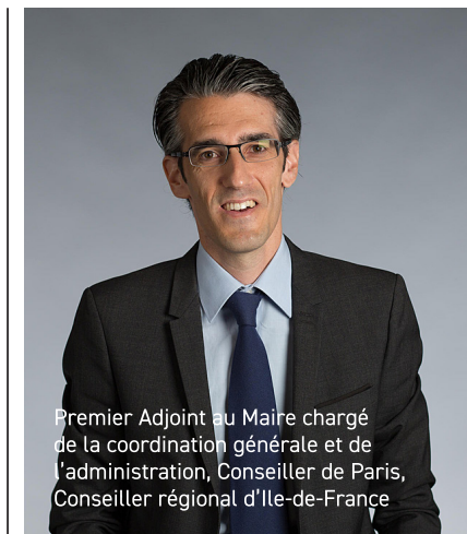
Premier Adjoint au Maire chargé de la coordination générale et de l'administration, Conseiller de Paris, Conseiller régional d'Ile-de-France